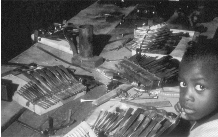
Foto aus einer Mbira-Werkstatt in Harare